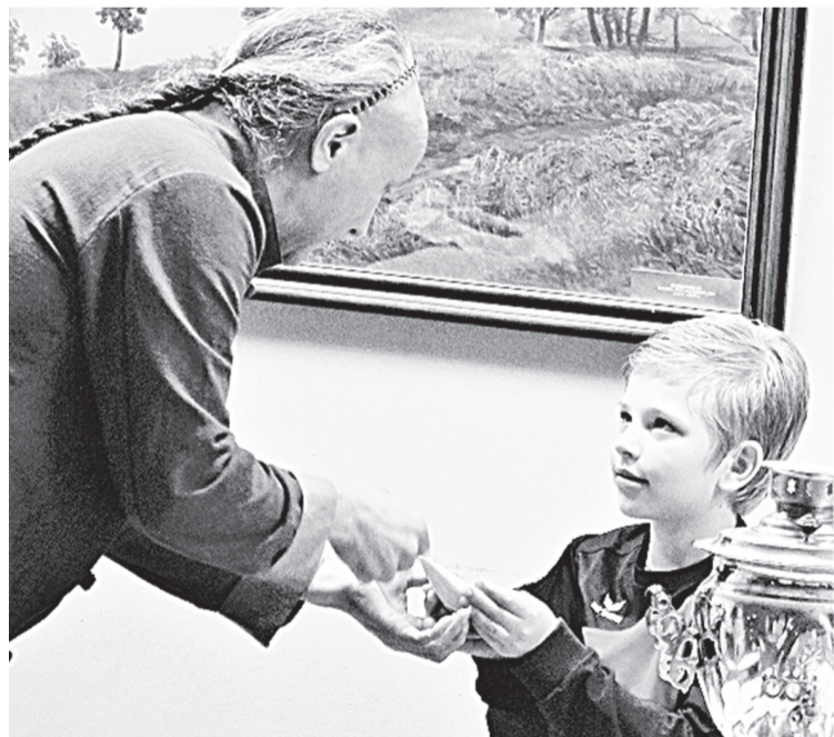
Передать чашку соседу нужно обязательно в полупоклоне, глядя в глаза друг другу