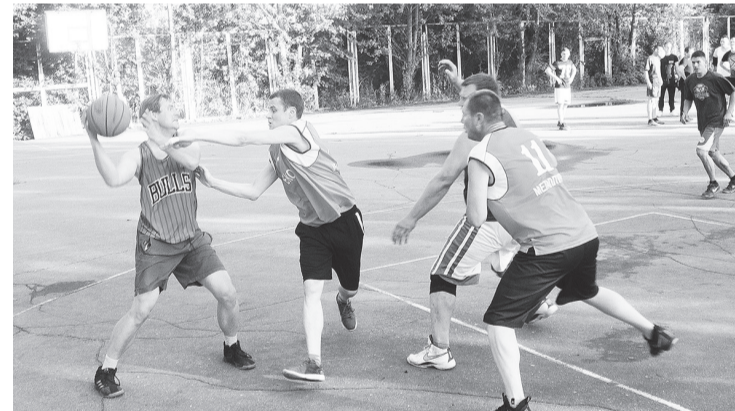
Стритбол на нижней площадке «Металлурга»