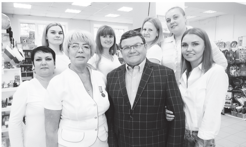
Руководители «Книжной лавки» и сотрудники магазинов

Городская сеть книжных магазинов отмечает своё 30-летие ©